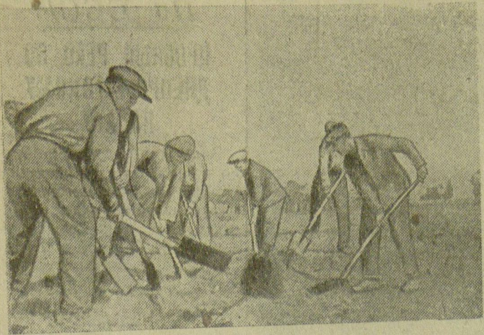
Колхозники сельхозартеля "Северо-Кавказский" (участок № 10) на земляных работах.